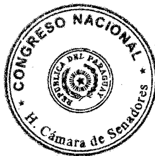
Fernando Lugo Méndez Presidente H. Cámara de Senadores

A Su Excelencia Horacio Manuel Cartes Jara Presidente de la República Palacio de López.